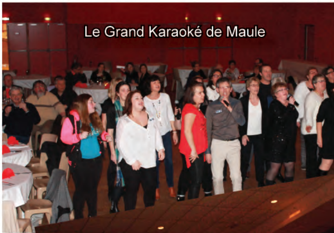
Le Grand Karaoké de Maule