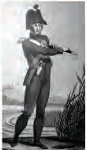
Garde champêtre en 1800

Déjà avant l'an 900, dans les archives des coutumes des seigneuries de France, on trouve trace des premiers gardes champêtres. Les premières appellations sont, selon les régions et l'évolution de la langue : messor, messilier, messaer, messarius, mésségué, messier qui, toutes, ont une seule origine le mot latin messis , qui signifie moisson. Le messier, mot qui subsistera jusqu'au début du XX ème siècle, a donc pour mission de surveiller les moissons dans les juridictions seigneuriales.