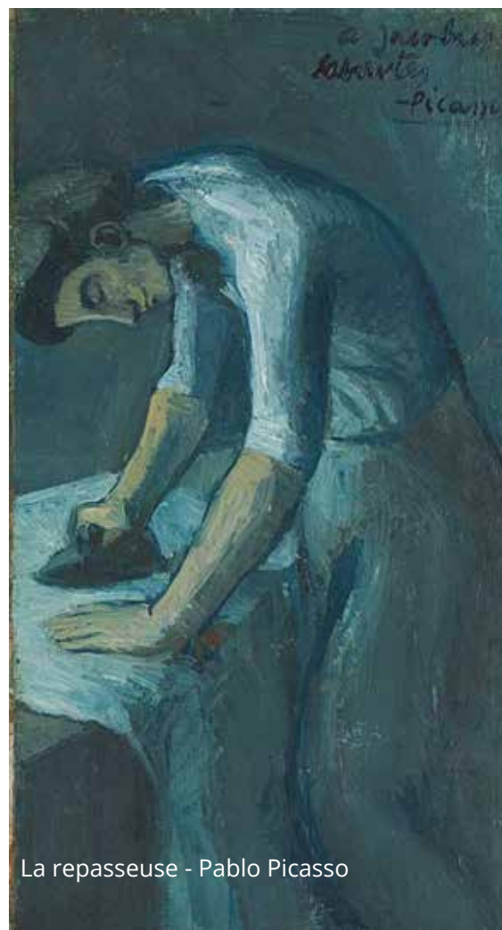
La repasseuse - Pablo Picasso

Quatre années plus tard, l'artiste entre dans sa période rose et peint avec plus d'élan et de gaieté notamment avec les personnages acrobates du cirque Médrano qu'il fréquente régulièrement (Acrobate et jeune arlequin). Cette période c'est aussi sa rencontre avec sa première femme, Fernande Olivier, et les thèmes de l'œuvre sont ainsi mélancoliques et dominés par les sentiments.