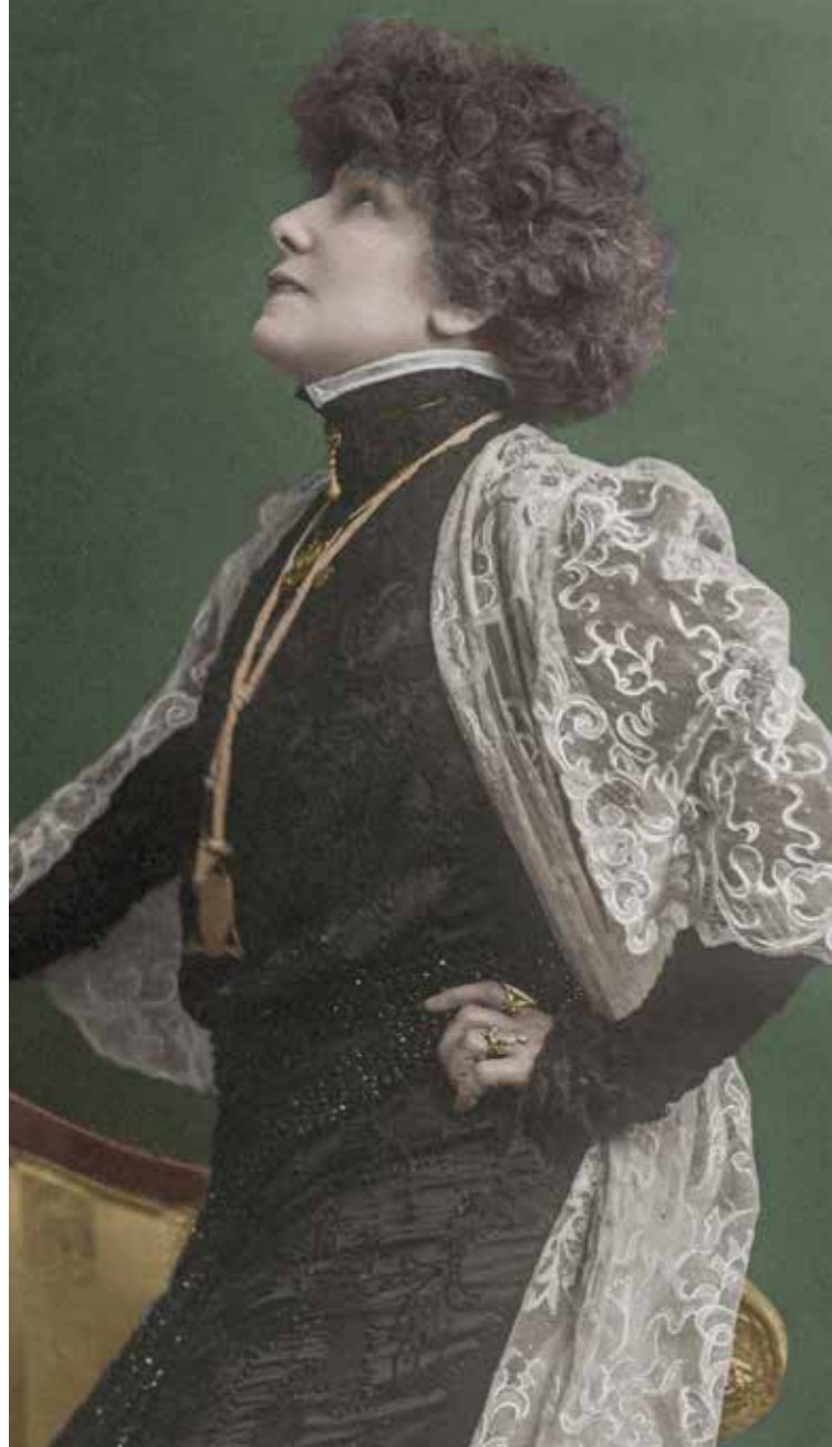
Sarah à 58 ans.

Mais Sarah souffre depuis longtemps d'une jambe, qu'elle se fait amputer tant la douleur est insupportable. Par solidarité avec les jeunes soldats se faisant eux-mêmes bien souvent amputer à cause de la première guerre mondiale, elle se fait amputer sans anesthésie, et se rend sur la table d'opération en chantant la Marseillaise.