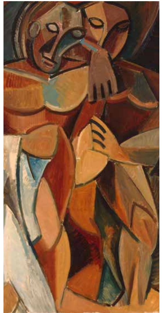
L'Amitié- Pablo Picasso

Sa rencontre avec Toulouse Lautrec se fait à la même époque et lui inspirera un retour à la figuration et au classicisme. Et puis, de nouveau, son esprit curieux le porte vers une nouvelle période.